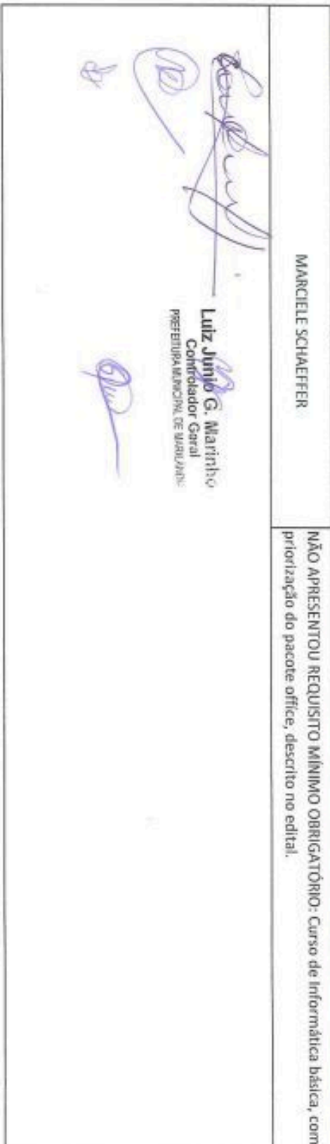
TABELA DE CLASSIFICAÇÃO FINAL DO PROCESSO SELETIVO SIMPLIFICADO - EDITAL Nº 001/2024

O PRESENTE ATO FOI FIXADO NESTA PREFEITURA DE MARILÂNDIA - ES EM, 10/2/2024